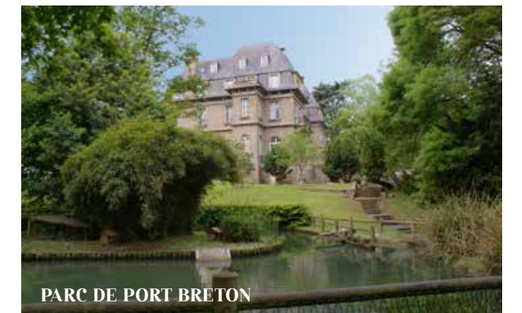
PARC DE PORT BRETON