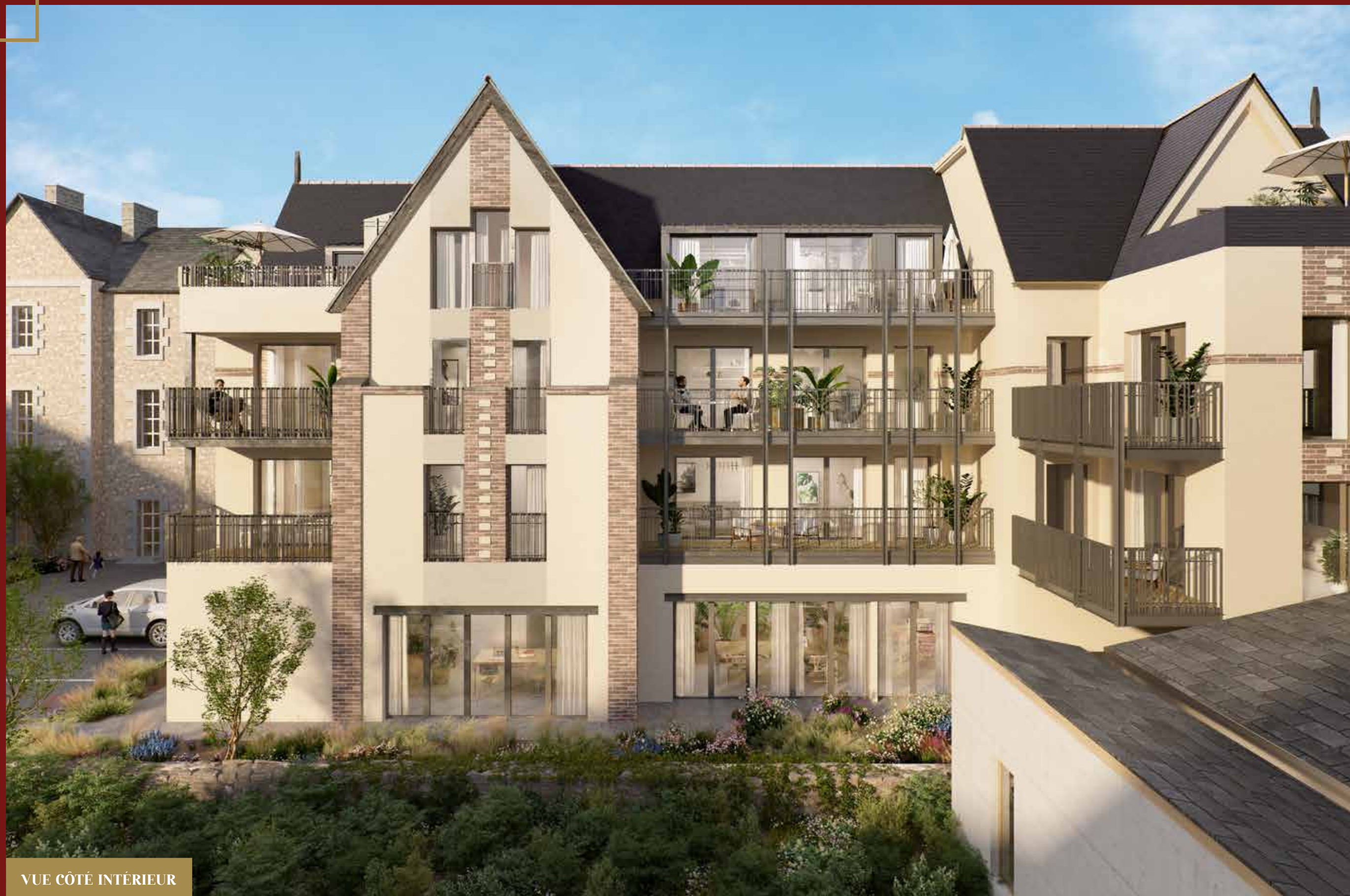
VUE CÔTÉ INTÉRIEUR