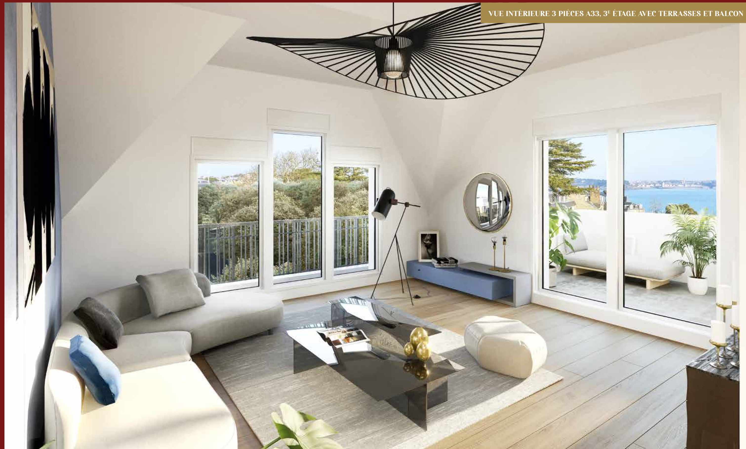
VUE INTÉRIEURE 3 PIÈCES A33, 3È ÉTAGE AVEC TERRASSES ET BALCON

* Vue intérieure simulée par photos drone au niveau du troisième étage