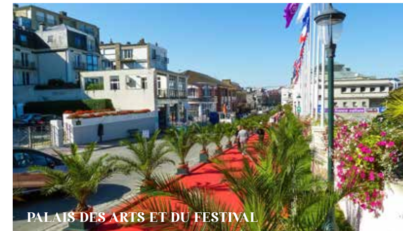
PALAIS DES ARTS ET DU FESTIVAL

La plage du Prieuré vous attend à moins de 300 mètres pour la baignade, la randonnée sur la promenade du Clair de Lune et les multiples activités développées autour des 23 hectares du parc du Port Breton (tennis, équitation, parcours sportif...). Un peu plus loin, le célèbre marché de Dinard et les galeries d'art complètent ce cadre enchanteur pour tous les sens.