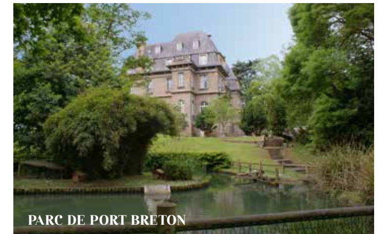
PARC DE PORT BRETON