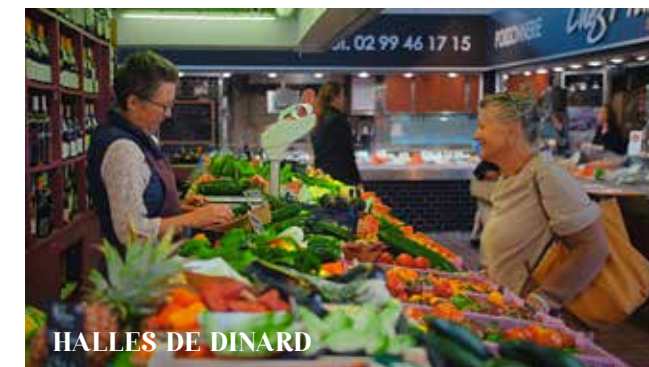
HALLES DE DINARD